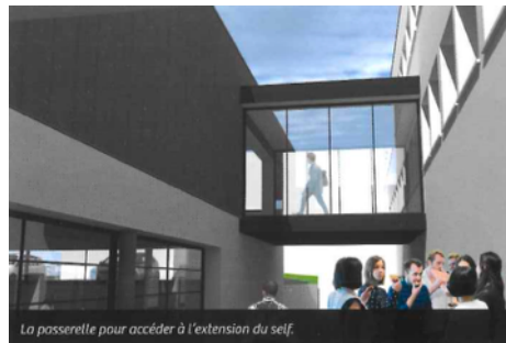
La passerelle pour accéder à l'extension du self.