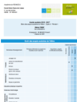
Sous forme de livret simplifié

Le bulletin de votre enfant est présenté de 2 manières :