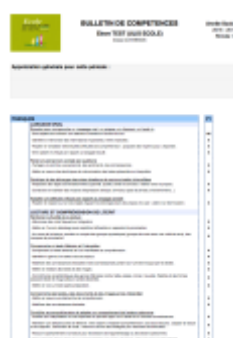
Sous forme de livret de compétences détaillées

L'enseignant de votre enfant a remis l'un de ses 2 livrets à votre enfant. Le second est consultable sur le site https://www.livreval.fr/rennes-2/index.php