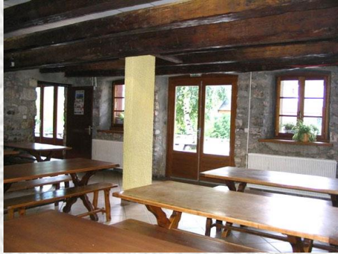
Le réfectoire et l'une des salles d'activités