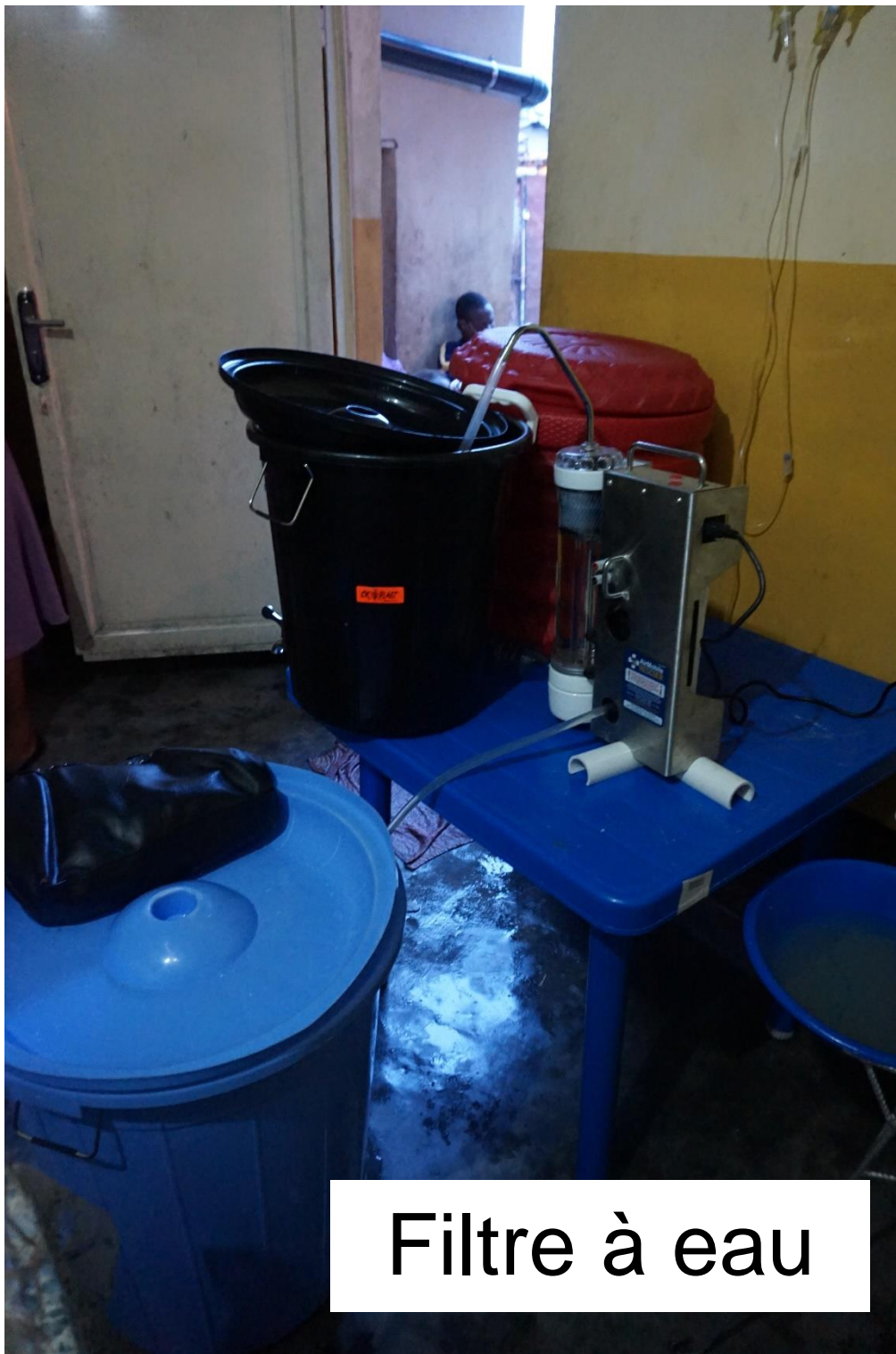
Filtre à eau