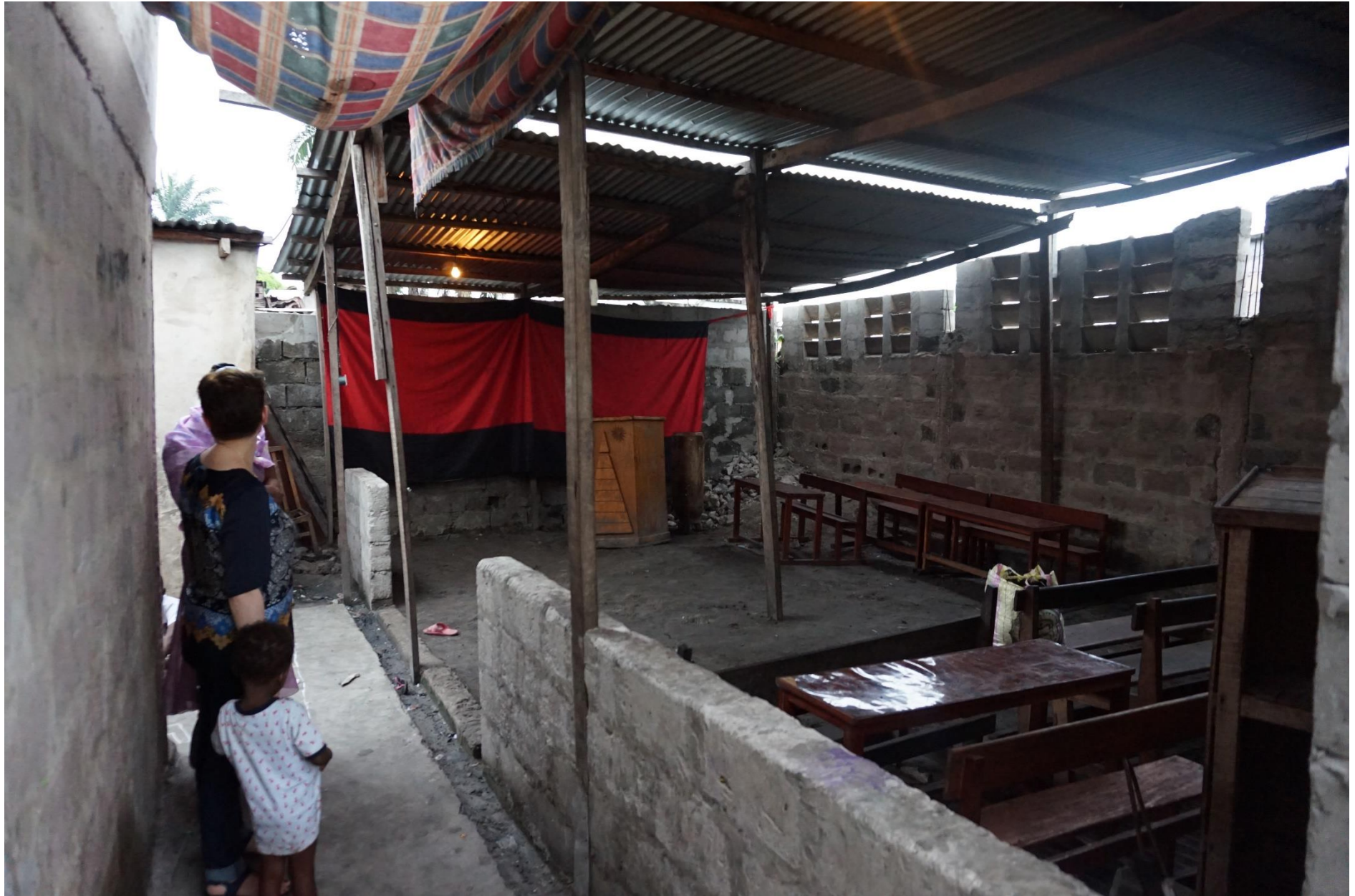
La salle de classe