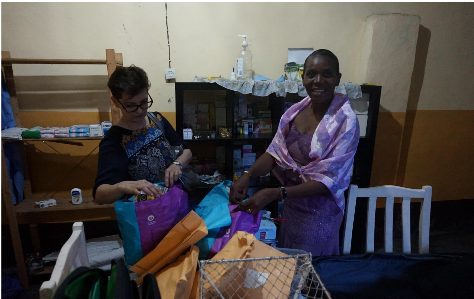
L'infirmierie CVE apporte des médicaments à SECAM