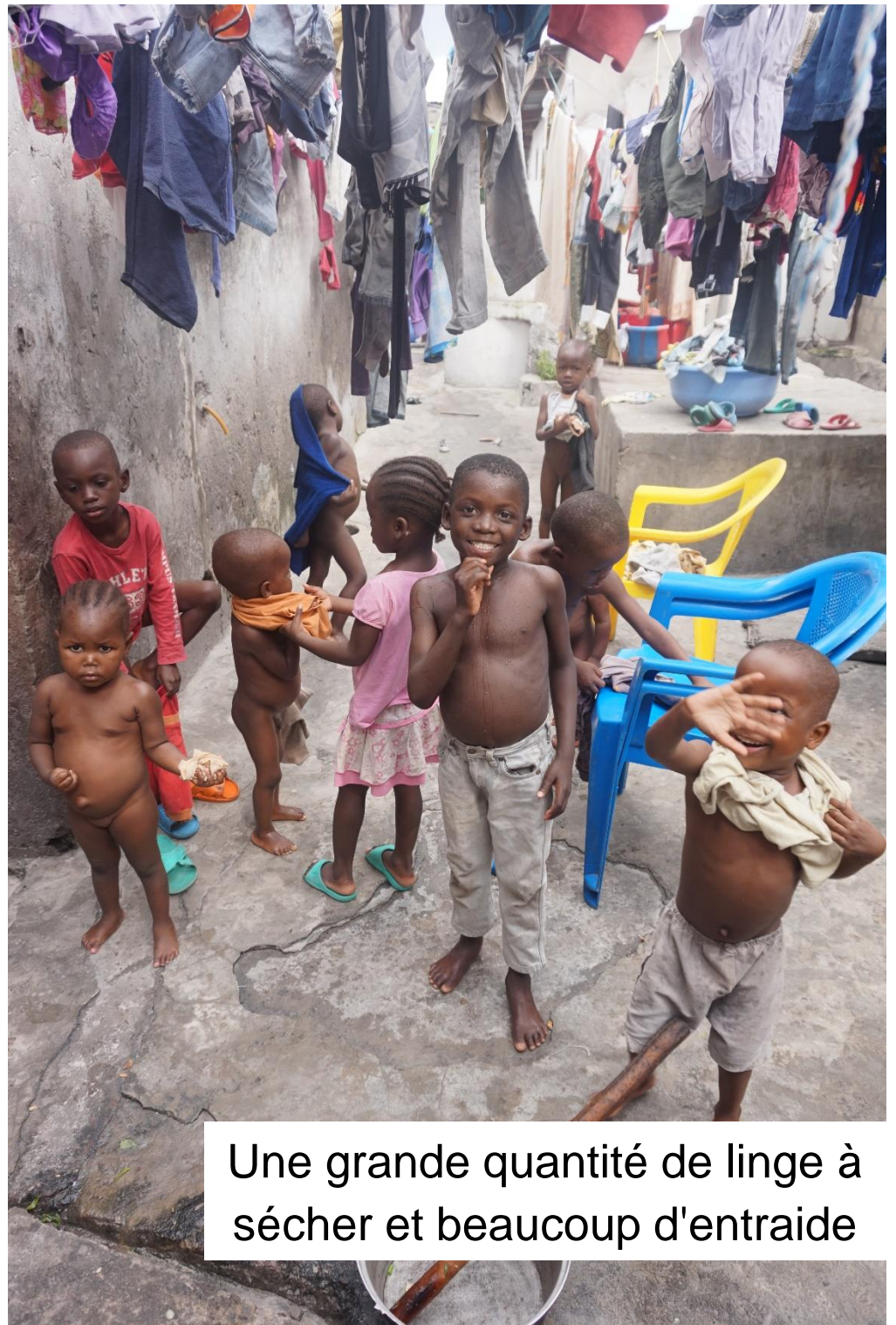
Une grande quantité de linge à sécher et beaucoup d'entraide