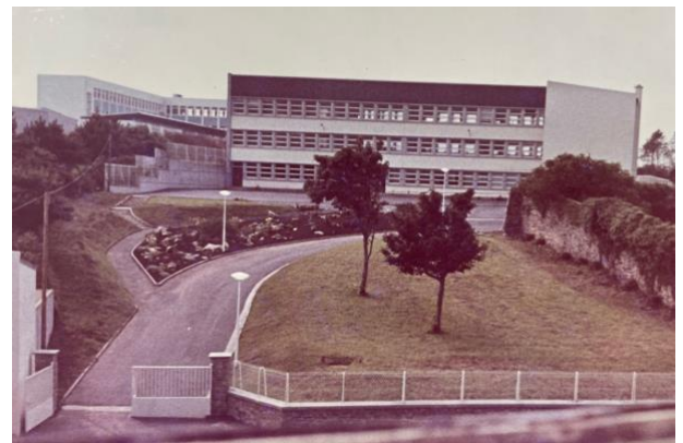
L'école élémentaire Notre Dame de Liesse en 1967

Ce début d'année 2021-2022 sera encore marqué par la pandémie du COVID-19. L'école Notre Dame de Liesse, depuis mars 2020, est fortement mobilisée. Les procédures sont rodées et s'adaptent progressivement selon les besoins et les orientations des services de l'Etat. L'inconnu et l'espoir d'une sortie de la pandémie marquent la rentrée. Nous continuerons à nous adapter avec toujours les 2 axes suivants toujours en tête : la sécurité sanitaire et la bienveillance envers les enfants qui doivent pouvoir rester des enfants et vivre leur enfance en construisant leur apprentissage et leur socialisation comme les autres générations d'enfants. Je salue le dévouement, le professionnalisme et l'esprit d'équipe de tous les agents et professeurs de l'établissement depuis le début de cette crise. Par citoyenneté et solidarité, dès le printemps, l'équipe s'est mobilisée pour entrer dans le processus de vaccination, c'est un gage de sécurité pour tous.